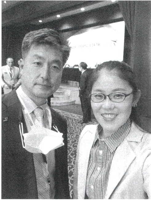
與亞洲跆拳道聯盟秘書長合影