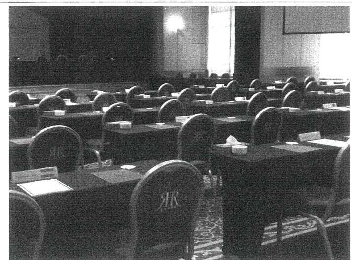
中華台北座位排序，在塔其克之後