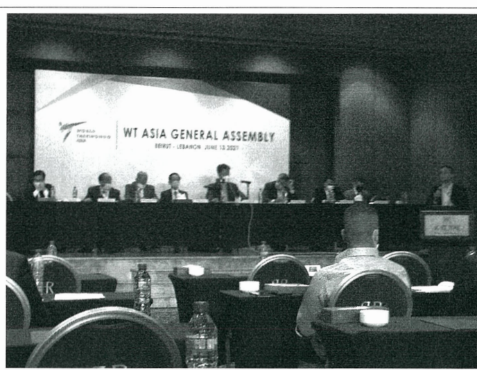
大會會議期間理事會及亞盟出席人員