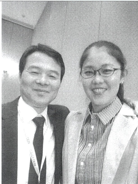
與韓國跆拳道協會理事長合影