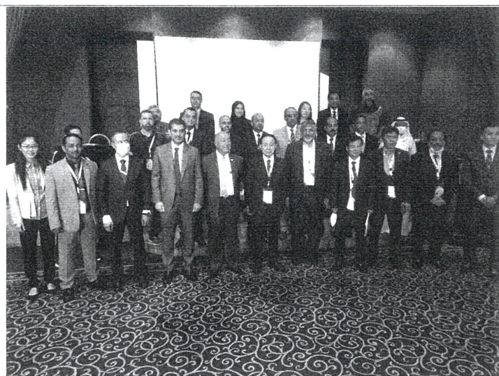
全體與會人員合影