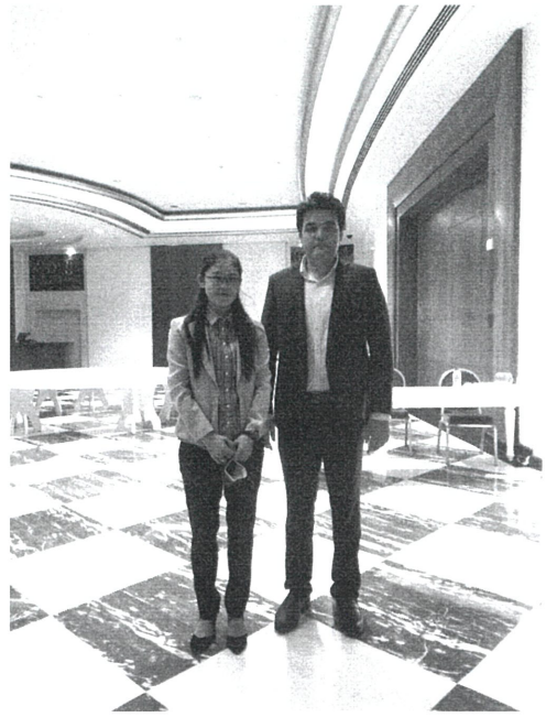
與烏茲別克秘書長合影