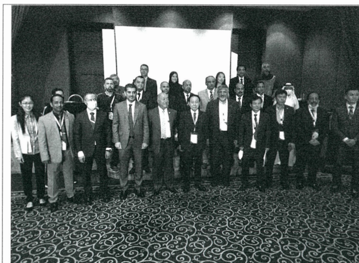
全體與會人員合影