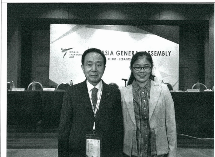
與亞洲跆拳道聯盟會長合影