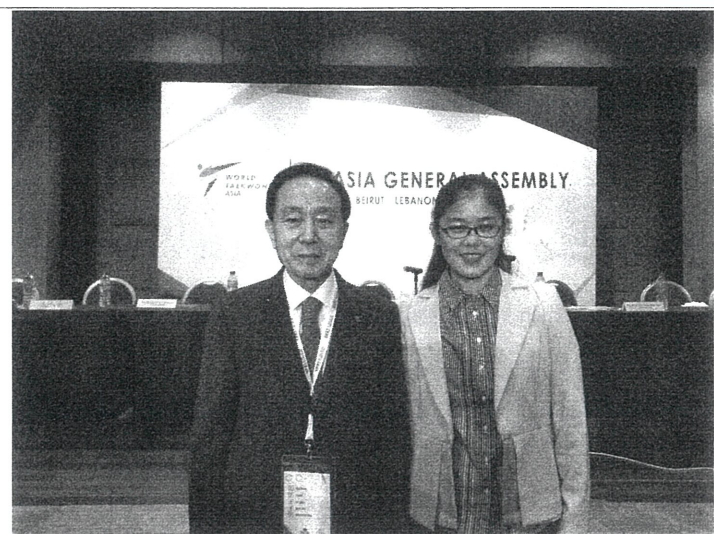
與亞洲跆拳道聯盟會長合影