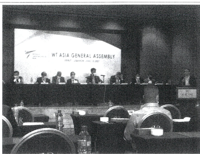
大會會議期間理事會及亞盟出席人員