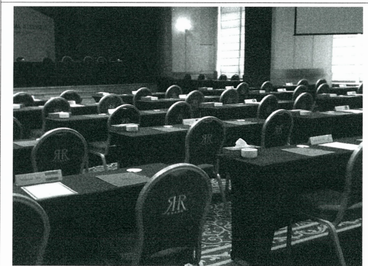
中華台北座位排序，在塔其克之後