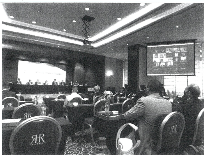
會員大會會議進行中