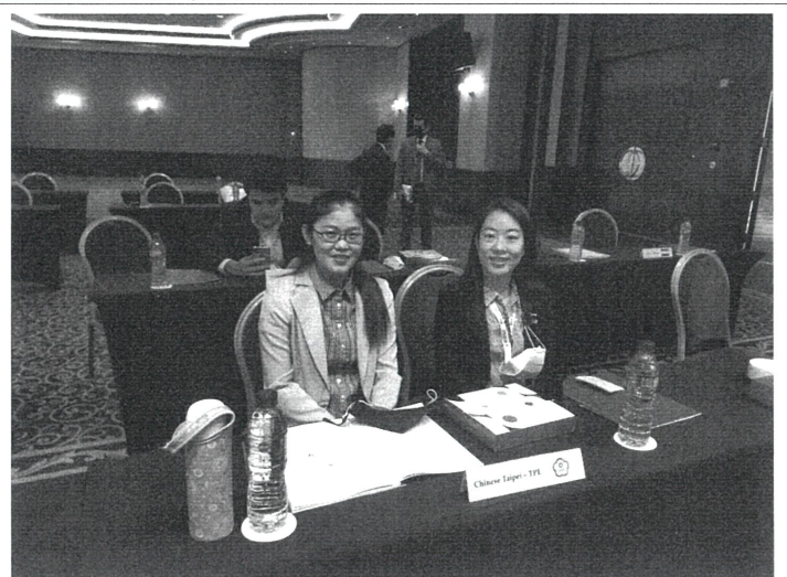
與大會工作人員合影