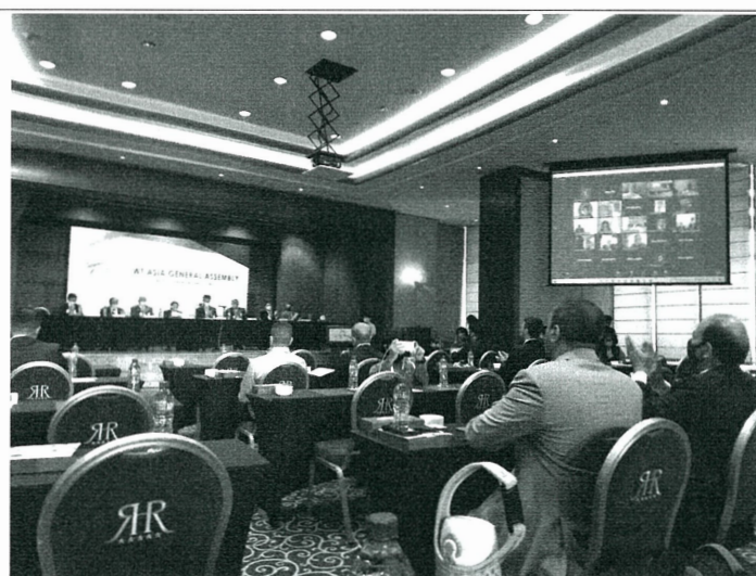
會員大會會議進行中