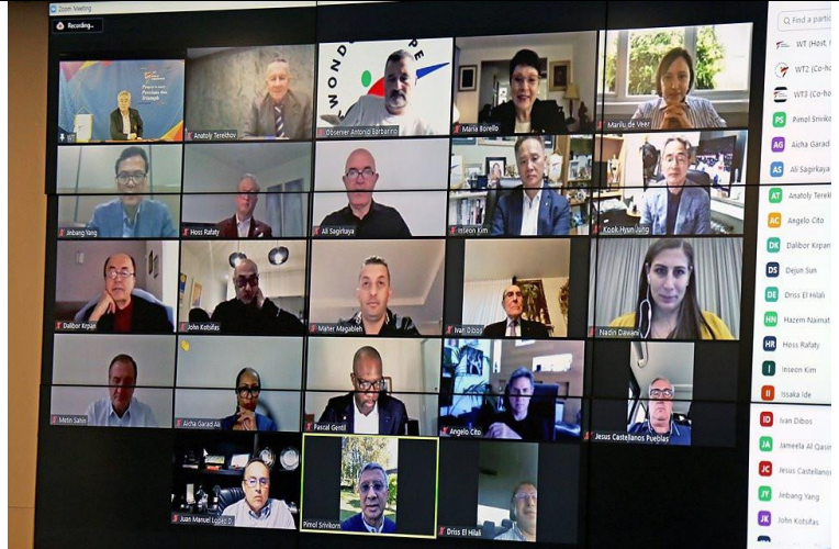
線上參與人員(部分)